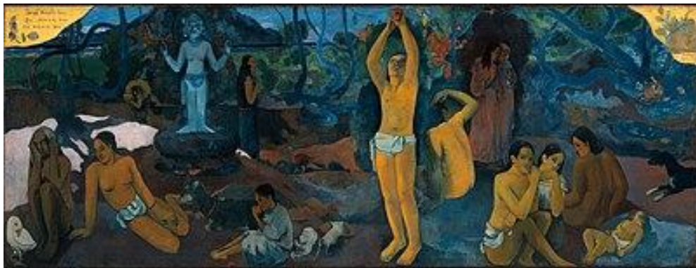
タヒチで描かれた作品(1897-1898年)ので、現在は米国マサチューセッツ州ボストン美術館に所蔵されている。

誰しもが突きあたるであろう、この「問い」は、私たちの人生・仕事において、「サステナビリティ経営」人材育成を研鑽するテーマ、組織(全体)の「自分ごと化(個)」を考える究極のテーマと思います。そして、人類の幸福と世界平和を目指すエネルギーをもたらしてくれるものと信じています。