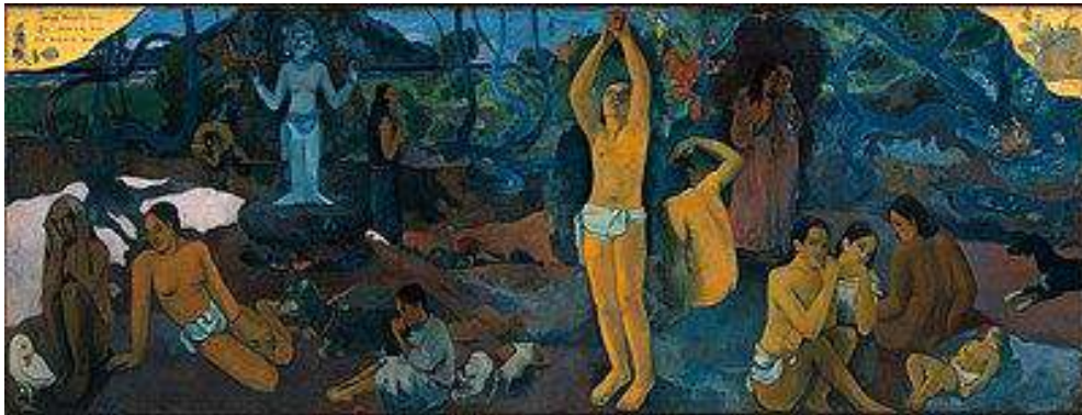
タヒチで描かれた作品(1897-1898年)ので、現在は米国マサチューセッツ州ボストン美術館に所蔵されている。

誰しもが突きあたるであろう、この「問い」は、私たちの人生・仕事において、「サステナビリティ経営」人材育成を研鑽するテーマ、組織(全体)の「自分ごと化(個)」を考える究極のテーマと思います。そして、人類の幸福と世界平和を目指すエネルギーをもたらしてくれるものと信じています。